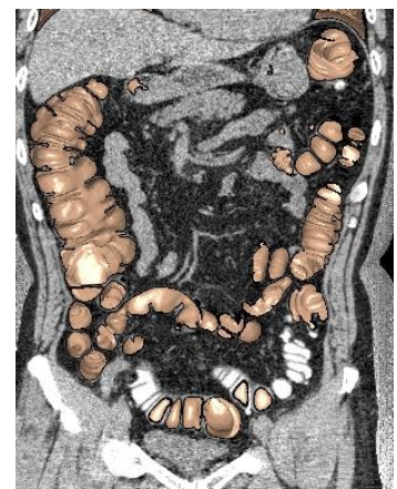
仮想内視鏡像+冠状断像