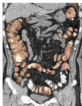
仮想内視鏡像+冠状断像